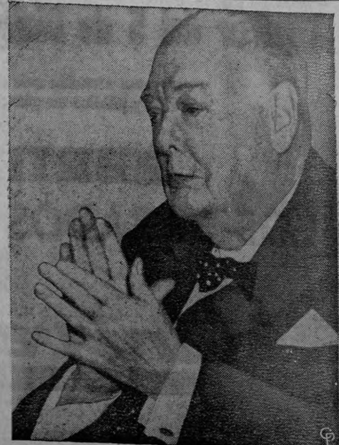
CHURCHILL CUMPLE 85 AÑOS.—Sir Winston Churchill celebró sus 85 años de edad con sus ojos firmemente fijados en el récord de longevidad para un Primer Ministro británico, implantado por William Gladstone, quien murió a los 89 años de edad.

NACIONES UNIDAS, 2 (UPI) — Gran Bretaña dio hoy su respaldo a Francia en un esfuerzo por evitar que las Naciones Unidas se abstengan de discutir la cuestión de Argelia, de manera que el Presidente francés, Charles De Gaulle, pueda resolver el asunto sin interferencia exterior alguna. Sir Pierson Dixon, Embajador de Gran Bretaña ante las Naciones Unidas, manifestó ante la Comisión Política que Gran Bretaña considera más conveniente dejar que el debate sobre Argelia concluya "sin resolución formal alguna que introduzca un nuevo elemento en el estudio de esta cuestión tan compleja".