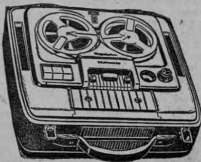
Grabadora portátil Sonido propio

cintas magnetofónicas "B.A.S.F." Surtido completo