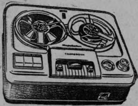
Modelo de mesa, con cualidades HI-FI. De dos velocidades.

Tiene enchufe para escuchar con auriculares o adaptarlo a un radio. Contador de longitudes de cinta. El manejo de las teclas es completamente automático.